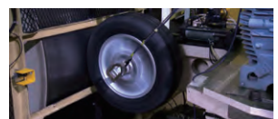
高速回転タイヤ計測技術

シミュレーションだけでは分からない実際の性能を確認するため、実走行状態での動的なタイヤの挙動を再現し可視化。ブリヂストンの独自技術です。